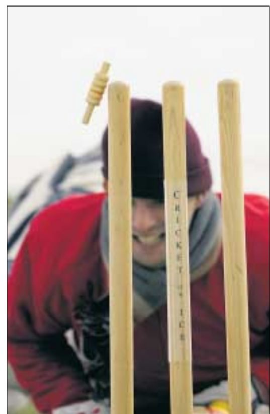
... und auch ein Streifen Kunstrasen auf der Schneedecke anstelle von gepflegten englischen Greens reicht ihnen vollkommen.