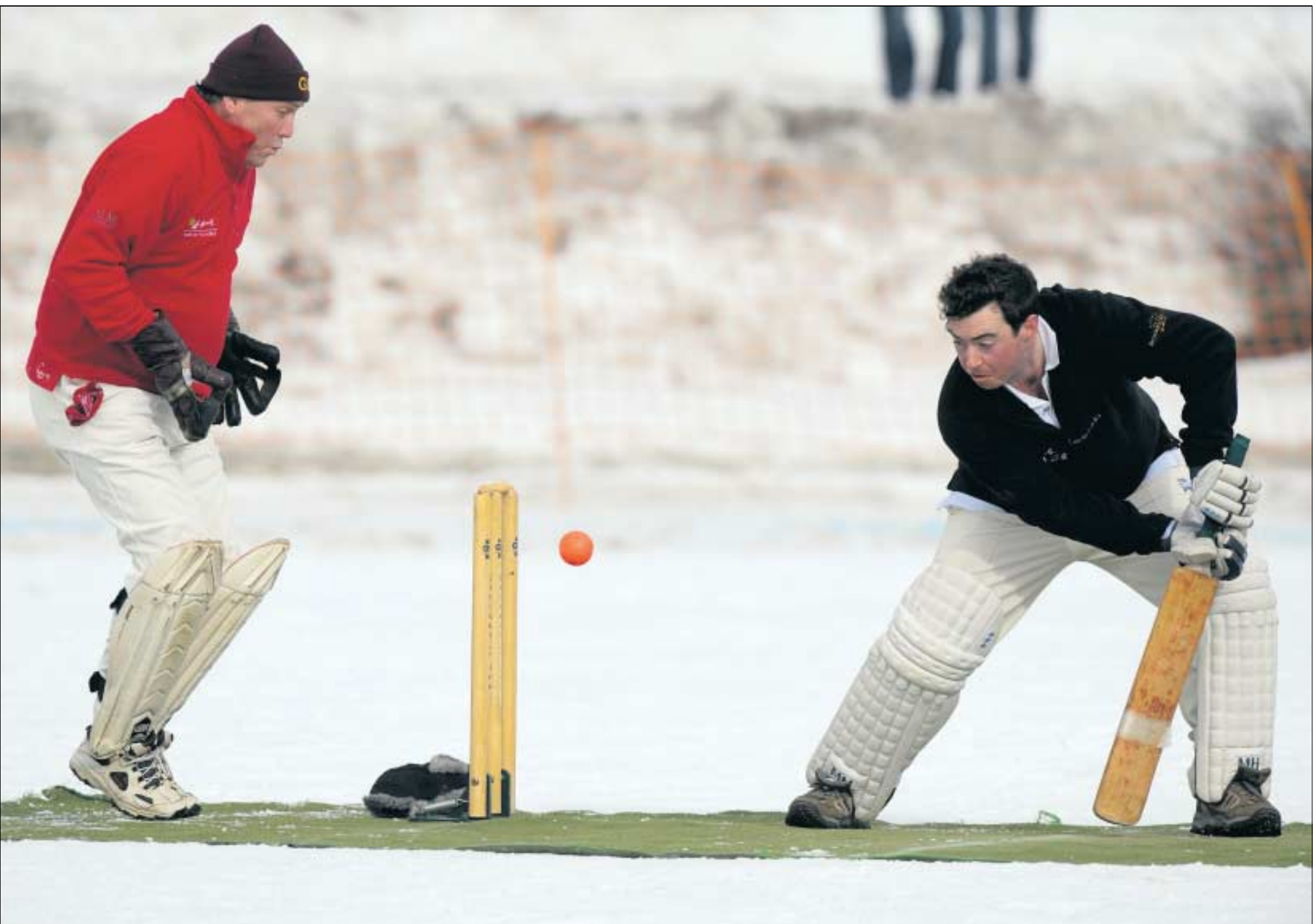
Cricket-Spieler sind anpassungsfähig. Die Freude am englischen Schönwettersport lassen sie sich nicht durch eisige Temperaturen vermiesen...