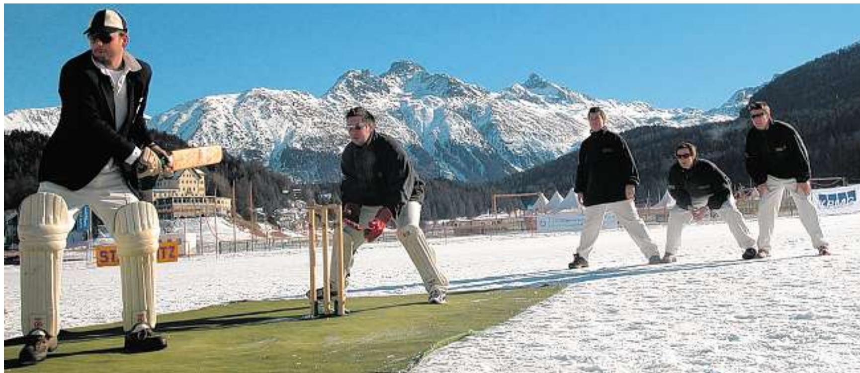
Viel Aufmerksamkeit um das Wicket herum: Der Batsman wird bei einem Cricket-Match auf dem St. Moritzersee von Spielern der Defensive beobachtet.

Im Engadin feiert ein Exot unter den Randsportarten sein 20-Jahr-Jubiläum. Cricket in der Schweiz ist an sich schon speziell, Cricket auf Eis jedoch selbst in Europa (fast) einmalig. Interessierte können sich ab heute davon überzeugen.